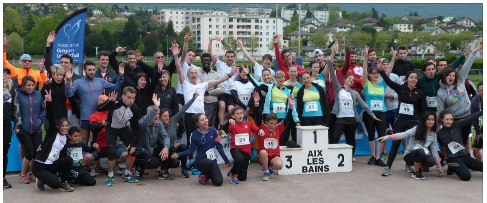
De deux à six participants par équipe, la course en relais a réuni une dizaine de "teams".

un brunch bien mérité. Plus que par le côté sportif, la "Run'Ipac" aura marqué par son côté festif. J.P.